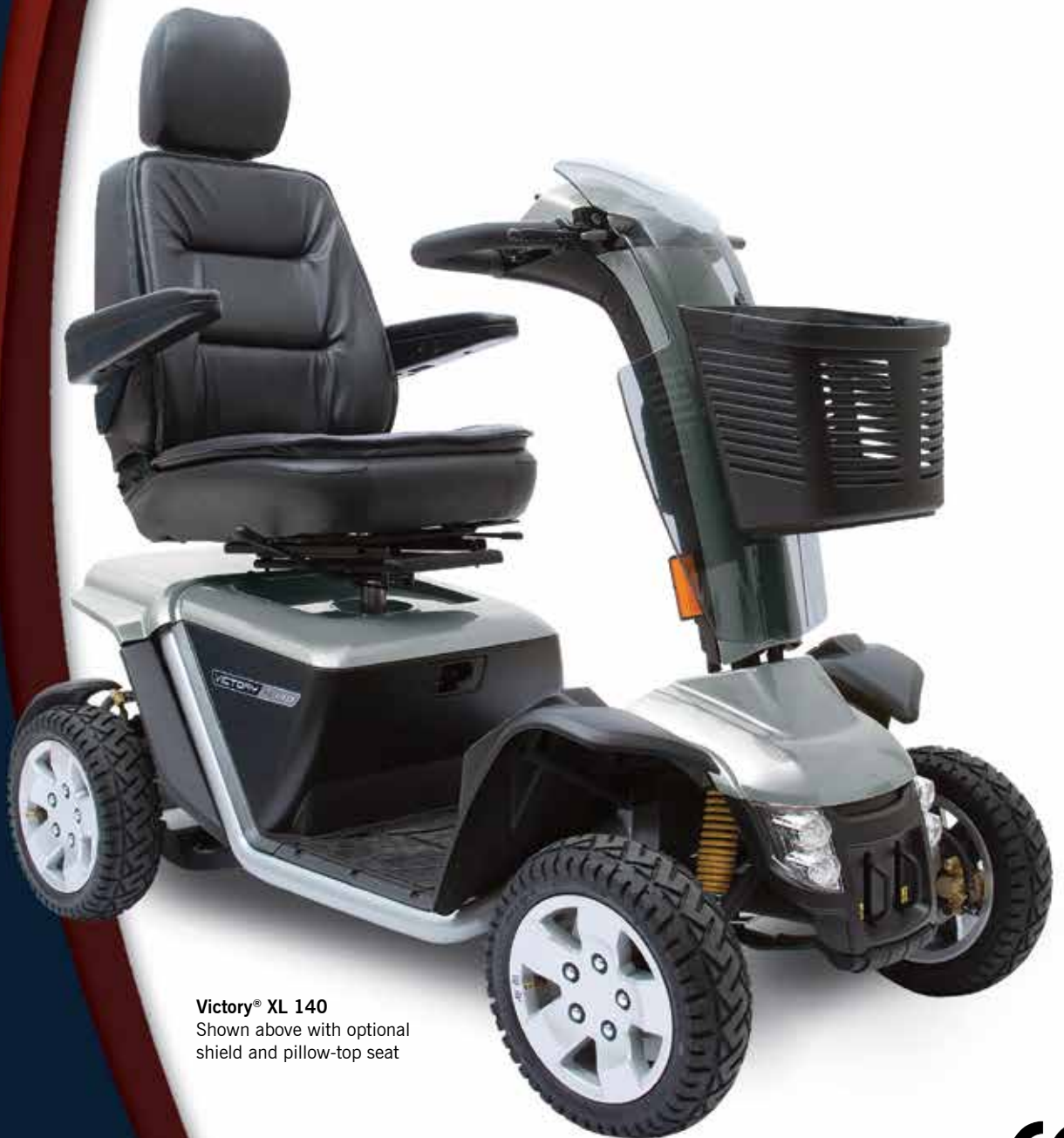
Victory® XL 140 Shown above with optional shield and pillow-top seat

De Victory® XL 140 is de ultieme mix van kracht en precisie en zit vol toepassingen van hoge kwaliteit, zoals volledige vering, platte profielbanden en een hydraulisch rem systeem. De Victory XL 140 kenmerkt een glanzende, agressieve stijl en een weelde aan standaard luxe zoals een doorlopend delta stuur en LED verlichting. Dit maakt de Victory XL 140 de ultieme scooter voor buitenshuis.